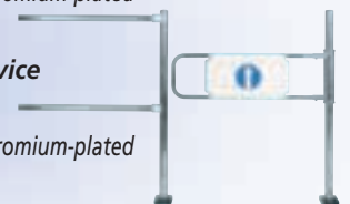
ohne Paniksicherung without panic safety device