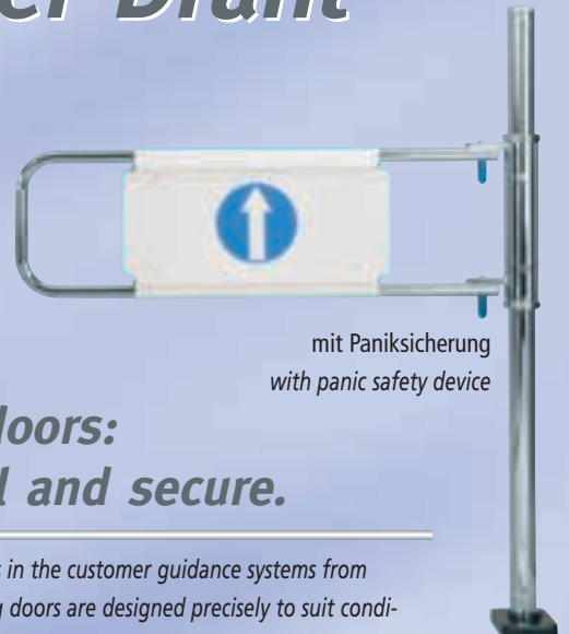
mit Paniksicherung with panic safety device

The panic safety device is an important safety accessory for entrance installations: pressing down hard on the door shaft in the locking direction opens the exit. The panic safety device is adjusted ex works to respond to an opening pressure of roughly 200 Newtons (equivalent to approx. 20 kilopond) at the center of the shaft.